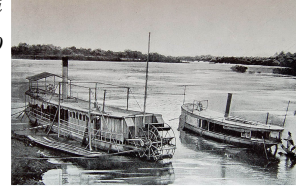
Les chaloupes de l'administration Hai Phong et Ham Luong au Laos vers 1900