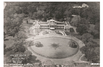
Saigon, palais du Gouverneur

Paul Doumer (1857-1932) gouverneur général de l'Indochine de 1896 à 1902, il renforce l'appareil administratif. Il achève la mise en place de la structure coloniale amorcée en 1887 (création de l'Union Indochinoise) avec un budget commun pour les 5 pays et en transférant la capitale à Hanoi. Il fut le fervent défenseur du chemin de fer trans-indochinois.