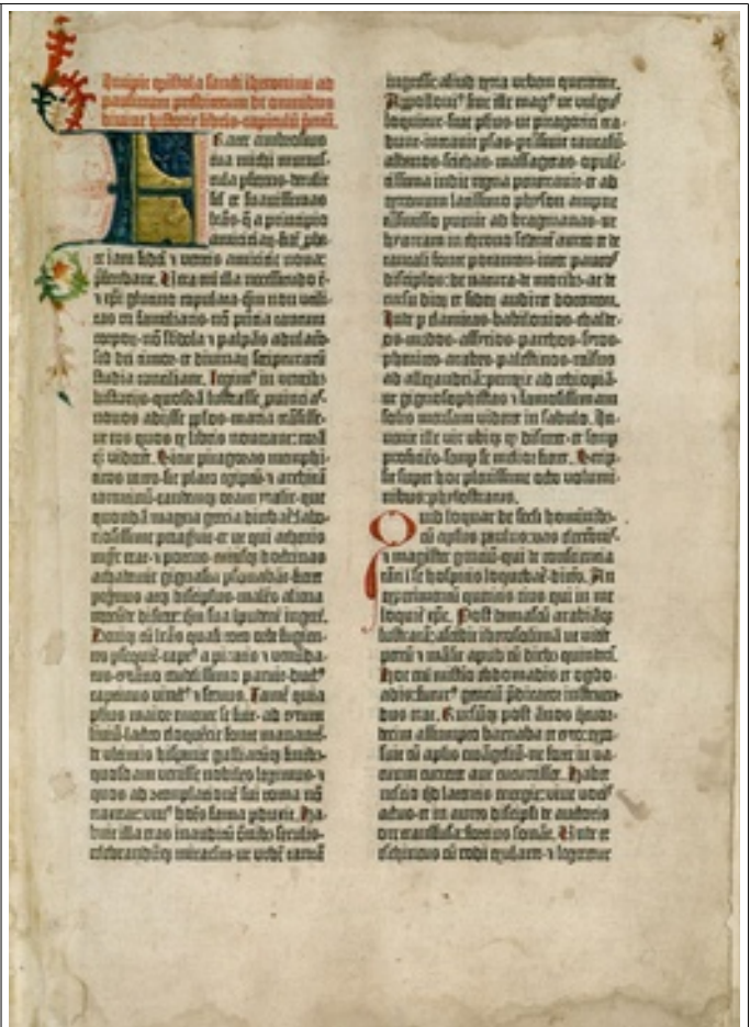
Au Moyen Âge, ce sont les moines qui recopient la Bible